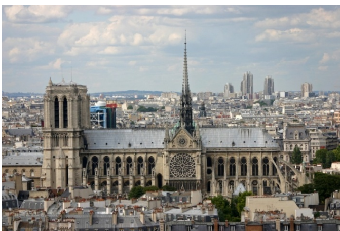
Fig.5. Catedrala Notre-Dames de Paris

Totodată, caracterul schematic este rezultatul dorinței scolasticilor de a explica ordinea și logica gândirii 29 . Acest aspect este întâlnit în arhitectura gotică prin suprapunerea registrelor de la punctul de sprijin, în cazul abației de la Saint-Denis, porțile sunt urmate de galeria împăraților, rozetă și turnuri, alcătuind astfel, același sistem prin care greutatea este transmisă treptat, iar în cazul scrierilor scolastice, "cititorul să fie condus pas cu pas de la o propoziție la alta". A treia asemănare este legătura strânsă dintre arhitect și scolastici, în măsura în care, un arhitect ar trebui să citească textele scolastice pentru a-și crea un habitus . Grația și caracterul estetic sunt determinate de verticalitatea catedralelor gotice oferită de arcul de cerc frânt (care are rolul de a reduce presiunea verticală), coloanele pe care se sprijină arcele ogivale la