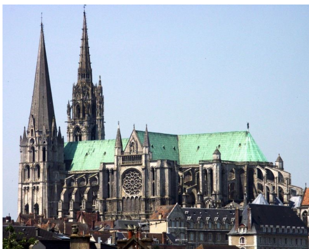
Fig.8. Catedrala din Chartres

O dispută care a influențat gândirea filosofică a fost cea dintre partizanii realismului și partizanii nominalismului scolastic 31 . Realismul scolastic era termenul care avea la bază două teze, universalitățile (genuri și specii) și care susținea că universalitățile există înainte și independent de lucrurile individuale, având un caracter general.