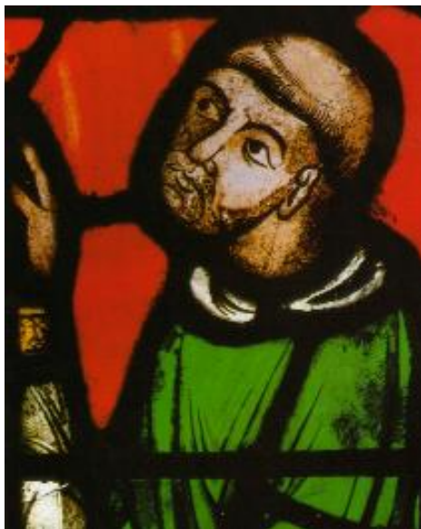
Fig.1. Abatele Suger – detaliu

caracterizată de apariția scolasticii timpurii 17 și de apariția primelor universități, unde se învață filosofie și greacă.