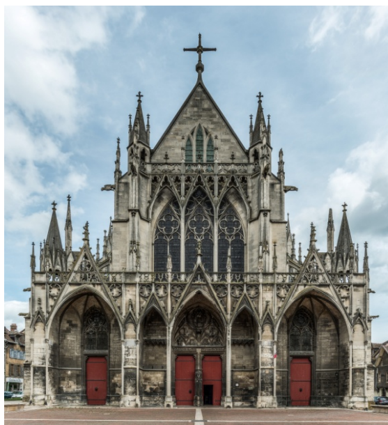
Fig.7. Biserica Saint-Urbain din Troyes

Arcul butant apare în jurul anului 1180 la Notre Dame din Paris și produce o adevărată revoluție în arhitectură. Proiectând spre exterior împingerile bolții, face să dispară tribuna (element folosit pentru susținerea bolților pe stâlpi) și reduce definitiv greutatea. Spre deosebire de stilul predecesor, goticul își plasează creațiile în centrul orașelor, fiind locuri de propagare a puterii și a celor două curente: scolastic și teologic. Monumentele cele mai reprezentative pentru arhitectura gotică sunt considerate: catedralele din Chartres , Bourges , Soisson , Reims , Saint Chapelle din Paris, Strasbourg și Mans și biserica Saint-Urbain din Troyes.