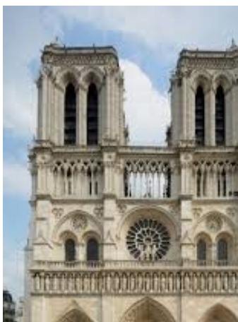
Fig.4. Catedrala Notre-Dames de Paris

Abatele Suger 27 , prieten și confident al regilor francezi, Louis VI și Ludovic al VII-lea, a decis în jurul anului 1137 să reconstruiască marea biserică din Saint-Denis, fiind înaintea bisericii de înmormântare a monarhilor francezi. Suger a început cu frontul de vest, reconstruind fațada carolingiană originală cu ușa sa unică. El a proiectat fațada din Saint-Denis pentru a fi un ecou al arcului roman al lui Constantin, cu divizia sa de trei părți și trei portaluri mari pentru a ușura problema congestiei. Fereastra de trandafiri de deasupra portalului de Vest este cel mai cunoscut exemplu, deși ferestrele circulare în stil romanic i-au precedat-o în formă generală. Pe de altă parte, caracterul schematic al scolasticilor este relevat în arhitectura gotică. Datorită acestui caracter, în secolul al XIII-lea, tratatele au început să aibă caracter general, fiind împărțite în "partes" (părți), în părți mai mici, apoi în: membra, questiones, distinctiones și articuli 28 . Ca dovadă a contribuției scolasticilor, orice carte din perioada contemporană este structurată în anumite "părți", "capitole", "subcapitole".