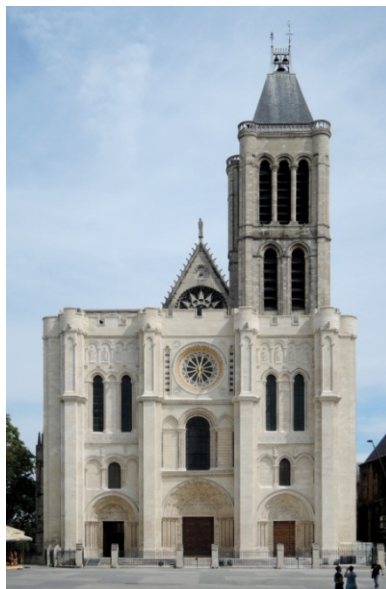
Fig.2. Fațada de vest a bisericii abațiale Saint-Denis

Scolastica este filozofia religiei, o mișcare de idei care a însemnat o formă de reacție pozitivă împotriva autorității tutelare a bisericii 18 . Epitetul de scolastic 19 era atribuit persoanei care predă cele 7 arte liberale în mănăstirile întemeiate de Carol cel Mare 20 sau îi era atribuit profesorului de teologie și ulterior oricărei persoane care se ocupa cu învățământul științei și al filozofiei.