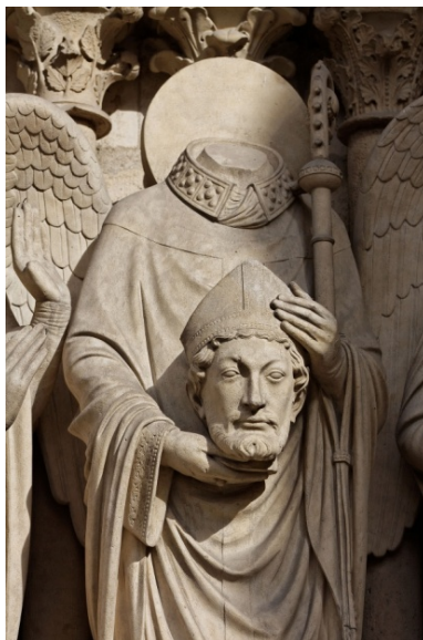
Fig.3. Sculptura cu Sf.Dionisie

acest motiv, arhitectura medievală era religioasă, catedralele fiind caracteristice stilului gotic.