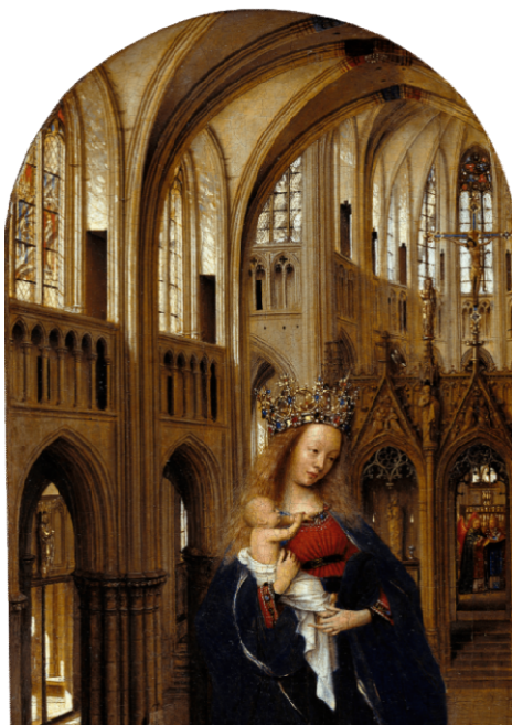
Fig.4. Jan van Eyck, Fecioara în biserică (1434)

De asemenea, pagina ce înfățișează Nașterea Sfântului Ioan Botezătorul (fig. 5) este fără îndoială pictată de Jan van Eyck; interiorul încăperii relevă paralele cu imaginea panoului din 1434 – Soții Arnolfini 18 (fig.6). Compoziția miniaturii este complexă, cromatică predominantă a celor două complementare verde-roșu amintește de soluționarea aceleași valori cromatice în pictura soților. În planul îndepărtat al camerei se pot întrezări personaje sugerate având același caracter misterios cu deschiderea spațiului precum se poate regăsi și în reflexia oglinzii concave a picturii