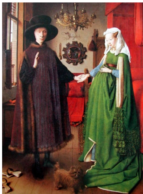
Fig.6. Jan van Eyck - Soții Arnolfini (1434)

Scena Răstignirii (fig.7) din manuscris atribuită unui învățat al manierei lui Jan van Eyck va lua naștere într-o viitoare operă pe lemn (fig.8) realizată de atelierul lui Jan van Eyck după moartea acestuia (c. 1445). Elementele compoziționale vor fi aproape identice, puțin schimbate în termen de cromatică și linii de construcție.