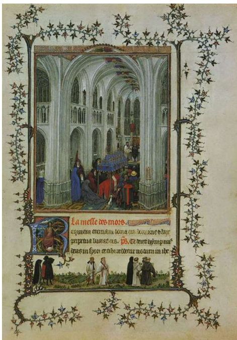
Fig.3. Liturghia pentru cei morți , Orele Torino Milano

Actualmente, este bine cunoscut faptul că Jan van Eyck a executat un număr de miniaturi în manuscrisul Orele Torino-Milano . Liturghia pentru cei morți 16 (fig.3) amintește de lucrarea flamandă pe suport de lemn din 1438 Fecioara în Biserică 17 (fig.4). Arhitectura goticului reprezentată în miniatura centrală coincide cu arhitectura bisericii unde o regăsim pe Maica Domnului cu Pruncul Iisus în brațe.