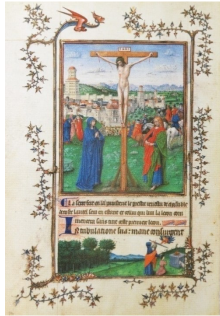
Fig.8. Școala van Eyck, Răstignirea , c. 1445

Frații van Eyck au avut un rol remarcabil inovator în pictura europeană. Pictura acestora minuțioasă și delicată prin acuratețea liniei și prin căutarea tabloului de gen în orice chip immortalizat în culoare, a intuit Renașterea artelor, aducându-și amprenta asupra mișcării artistice. Aceștia au străbătut în picture lor, printr-un salt, o distanță din evoluția artei care ar fi trebuit să se extindă asupra câtorva secole.