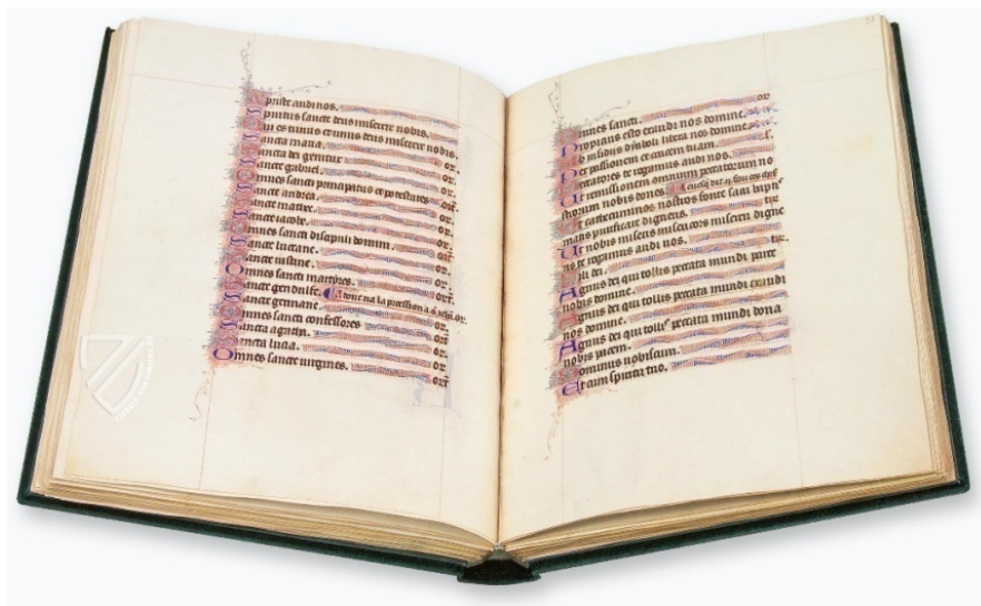
Fig.1. Manuscrisul miniate Orele Torino Milano (cca. 1380-1449), Muzeul Civic de Arheologie Milano

până la „Hand K”. El a atribuit miniaturile „Hand G” lui Hubert van Eyck 13 , iar lui Jan celelalte mai puțin impozante „Hand H”. Astăzi, mulți istorici identifică afilierea lui Jan cu „Hand G”, și atribuie miniaturile, „Hand H” unui presupus învățat sau ucenic al școlii acestuia 14 . Totuși, dezbaterea despre identitatea „Hand G” continuă.