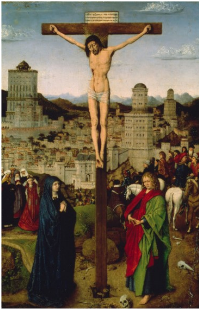
Fig.7. Școala van Eyck, Răstignirea Orele de la Torino-Milano