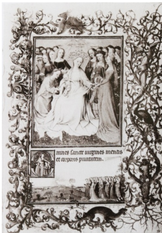
Fig.2. Fecioara între sfinte (dispărută), Orele Torino-Milano , Biblioteca Națională Universitară Torino

Formatul manuscrisului este de aproximativ 28x20 cm. Aproape toate paginile ilustrate cu miniaturi au același format, cu o imagine principală deasupra a patru linii de text și o imagine îngustă de „ bas-de-page ” ( picioarul paginii ). Cele mai multe miniaturi marchează începutul unei secțiuni de text, ce are în prim-plan inițiala minuțios ornamentată. Granițele, cu o singură excepție, urmăresc același design relativ simplu al frunzișului stilizat, tipic perioadei în care a început lucrarea, fiind în mare parte sau în întregime din prima fază de decorare din secolul al XIV-lea. Singura excepție de la stilul frontierelor este o pagină distrusă, cu miniatură principală- Fecioară între fecioare (fig. 2) de mână H. Granița este aici într-un stil mai bogat completat în tradițiile gotice internaționale târzii ale secolului al XV-lea. Această miniatură a fost atribuită lui Hubert van Eyck datorită stilisticii legate de Goticul Internațional.